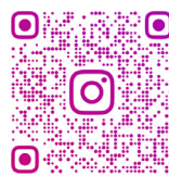
本院 Instagram 專頁 College Instagram Page