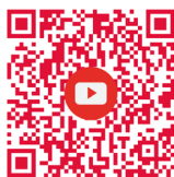
本院 YouTube 頻道 College YouTube Channel

如欲了解更多我們在中國文化推廣方面的工作，請瀏覽新亞書院的網頁 www.na.cuhk.edu.hk 。